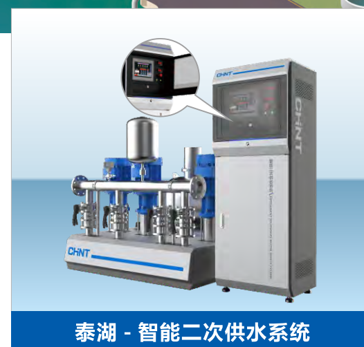
太湖 - 智能二次供水系统