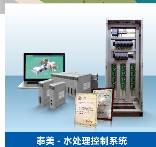
泰美 - 水处理控制系统