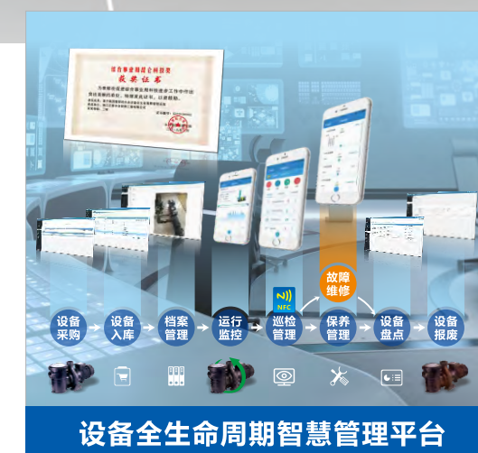
设备全生命周期智慧管理平台