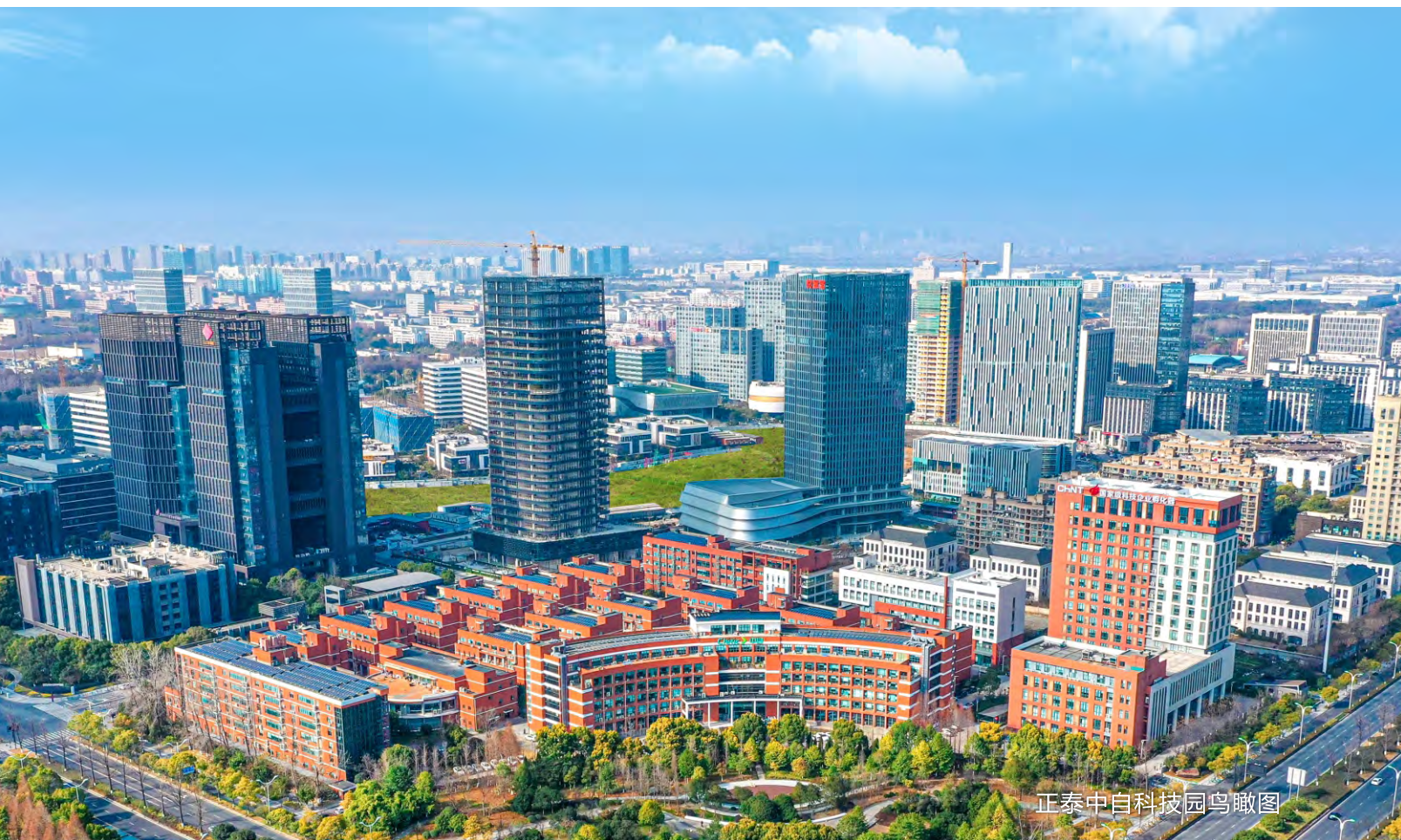
正泰中自科技园鸟瞰图