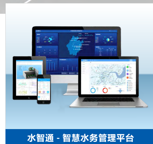
水智通 - 智慧水务管理平台