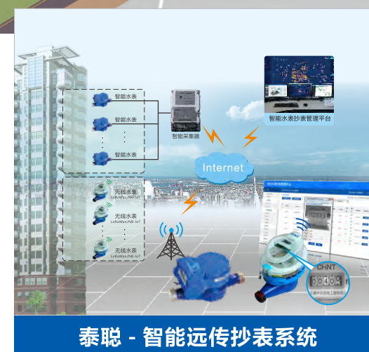
泰聪 - 智能远传抄表系统